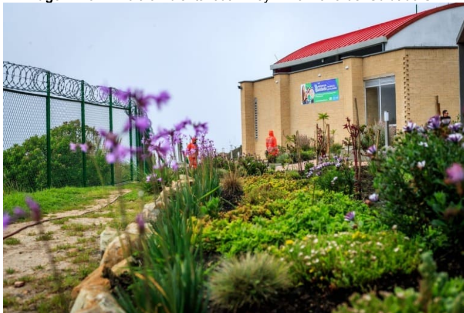
Imagen nro. 1. Aula ambiental Juan Rey – Manzana del Cuidado SDA

El desarrollo de acciones de educación ambiental, entre ellas los recorridos de interpretación ambiental, ha contribuido significativamente a promover y fortalecer el conocimiento ambiental en los diferentes grupos poblacionales. Estas actividades se han enfocado en el reconocimiento del territorio, a través de experiencias vivenciales que favorecen la apropiación social del entorno, de los ecosistemas presentes y de elementos clave como la fauna y flora, con especial énfasis en el corredor ambiental de los Cerros Orientales.