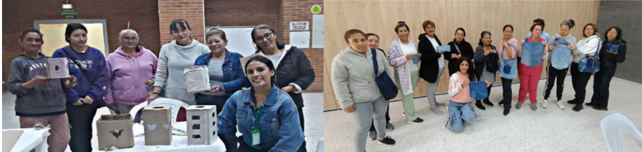
Imagen nro. 4. Registro fotográfico Actividades Manzana de cuidado - Actividades Manzanas del cuidado Juan Rey.